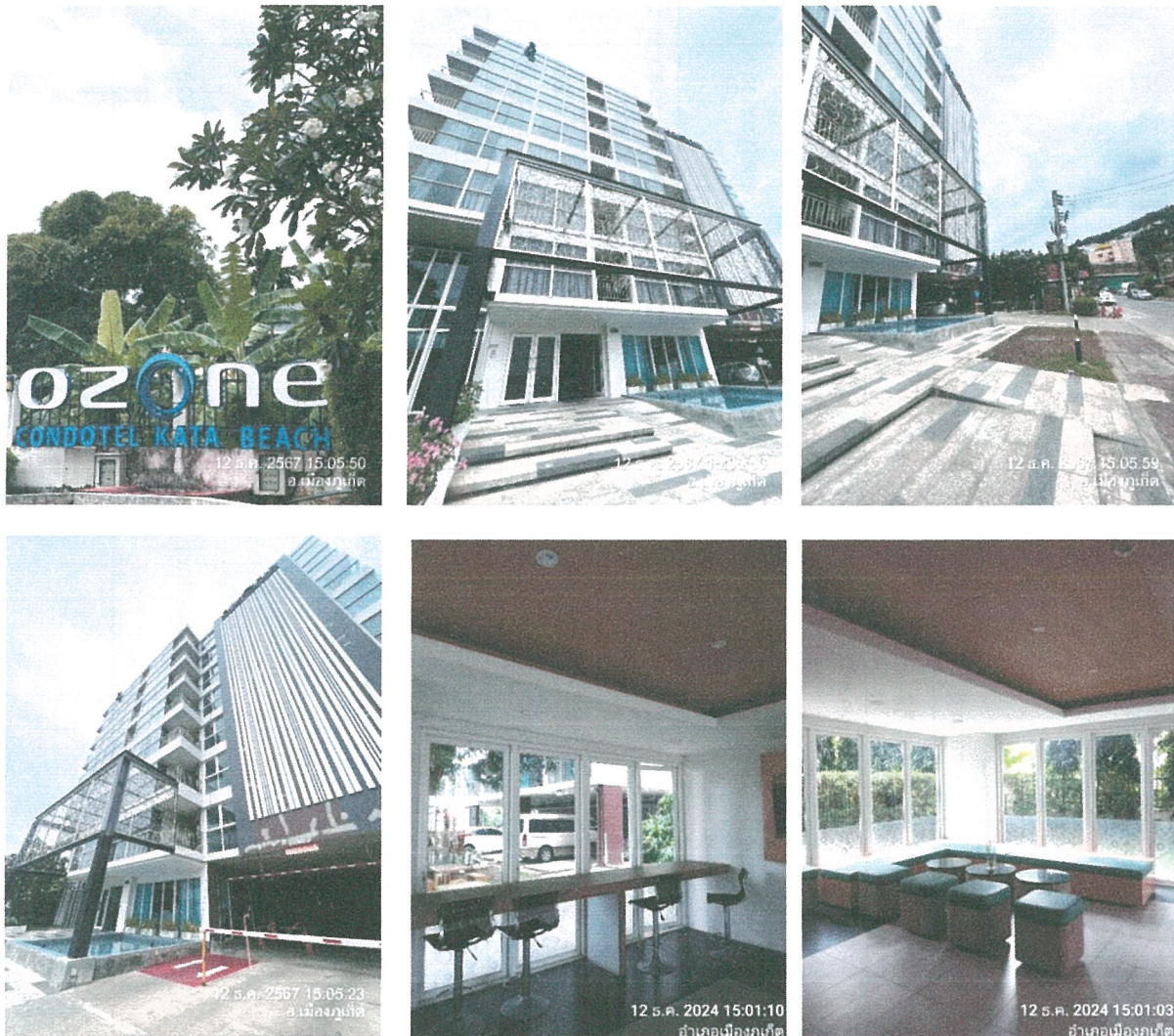
รูปภาพที่ 1.4 การใช้พื้นที่ของโครงการ